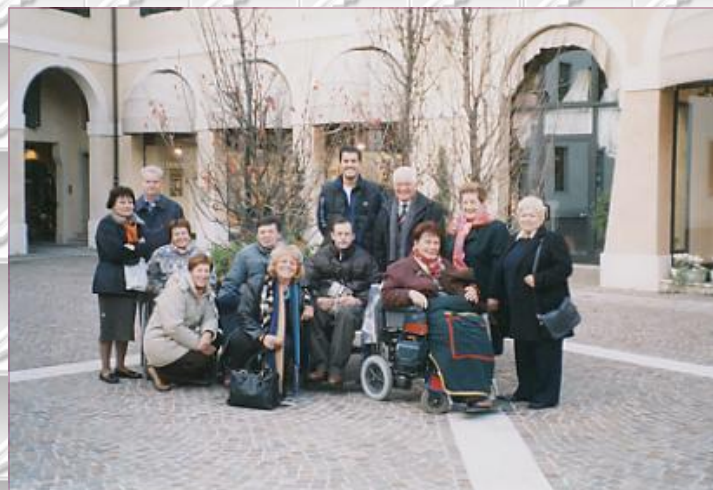
Padova - visita guidata alla mostra dei "I MACCHIAIOLI".

Ringrazio l'AISM per l'opportunità avuta di lavorare con queste splendide persone; l'augurio è quello di continuare a ritrovarci per lavorare, ridere scherzare e divertirci.