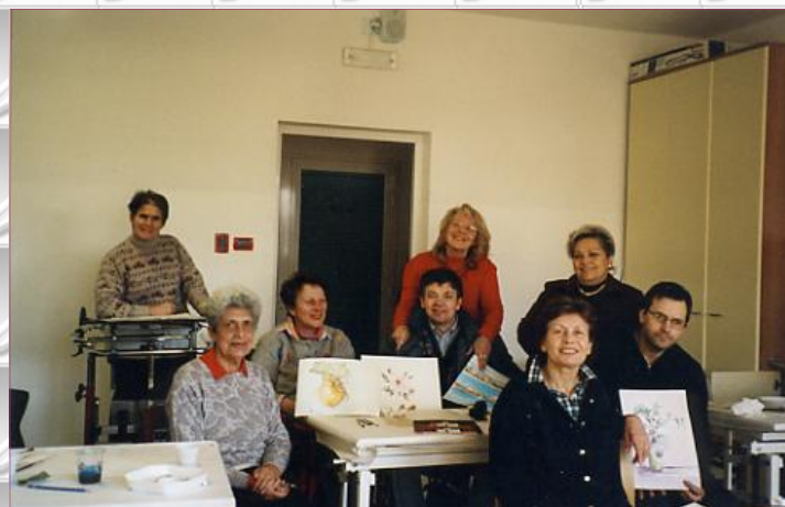
Artisti in ... "mostra"