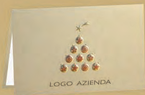
Esempio di personalizzazione sulla copertina.

È possibile personalizzare la copertina del biglietto con stampe in oro, argento oppure a rilievo.