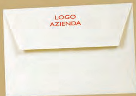
Esempio di personalizzazione sulla busta.

Su richiesta è possibile personalizzare anche le buste, con logo e /o ragione sociale dell'azienda.