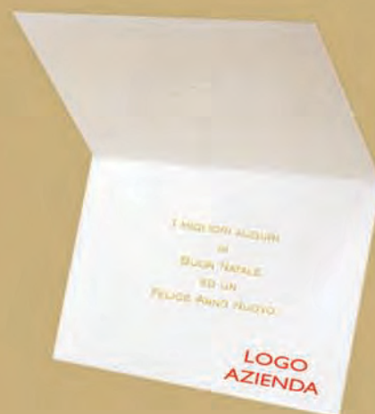
Esempio di personalizzazione all'interno del biglietto.